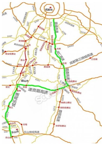
乐山至成都绕行路线1

第二阶段,成都至乐山方向K43-K82+200青龙场枢纽至眉山南枢纽段,预计将于8月27日18时至11月27日18时进行全线封闭。其余管制措施届时根据实际情况进行动态调整,将另行发布通告。