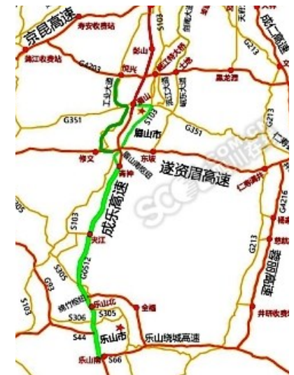
乐山至眉山绕行路线