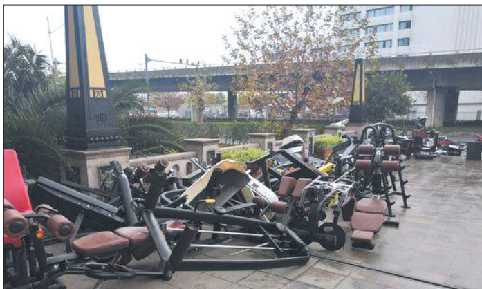
健身器材歪歪斜斜地躺在地上

这年头,一些健身房办卡的速度,可能还跟不上老板“跑路”的速度……近日,位于成都成华区双荆路1号泰业北城广场3楼的小熊健身店,在关门前几天还在做活动,招募会员去办卡买私教课。不料,在12月2日,健身店张贴出一张通知:由于公司资金链运转出了问题,现做出转店通知,并声明剩下的会员时间不变,都转到隔壁的一家名为“圣菲健身”的健身房……但12月9日,会员们发现,小熊健身房正在清理店内的健身器材,打算连夜搬走。