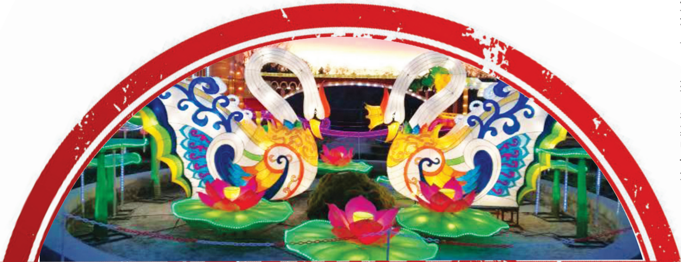
法国盖 亚克·中国彩 灯节天鹅湖。

曾在 2017 年德国 G20 峰会 期间,举办“感知 中国 环球灯会 ——中华彩灯汉 堡行”