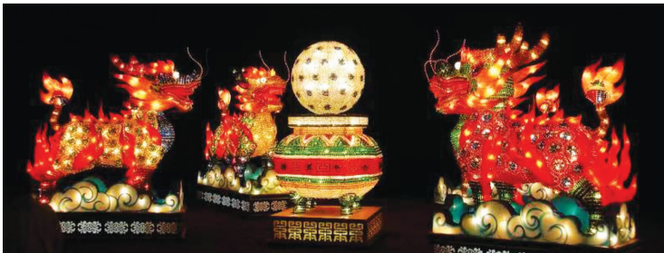
获“铜环奖”的《麒麟献瑞》玻璃药瓶灯组。