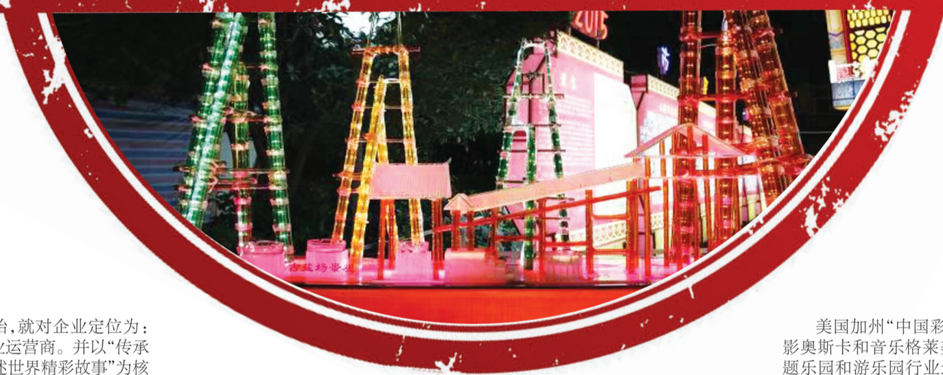
玻璃吹 塑灯·古盐场 景观。

集团成立伊始,就对企业定位为:全球灯彩文化产业运营商。并以“传承中国优秀文化 讲述世界精彩故事”为核心理念,以“用灯彩文化诠释中国精神为世界文化贡献中国价值”为使命,以“破局 亮剑”为企业文化,旨在通过自身努力,实现自贡灯彩文化行业的转型升级,引领产业未来发展方向。在经营思路,摆脱了“就灯言灯”的思维方式,密切关注中国文化走出去、全域旅游、美丽乡村、特色小镇、夜游经济、城市亮化、产业链完善和资源整合等领域,更加重视未来发展方向;创建了以中华灯彩和灯会为载体的区域性文化旅游品牌的商业模式,以文化创意和自贡制灯技艺所蕴含的无限创造能力,为区域性文化旅游品牌提供白加黑(白天和夜晚),一加三(四季)等丰富的内容;以合作共赢的理念和实践获得市场三权(主动权、话语权、定价权);以携手并肩,长期合作的方式赢得未来发展空间等等。