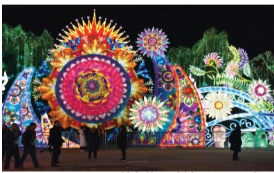
《繁花似锦》灯组局部。