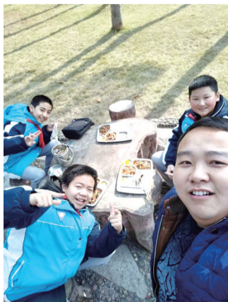
师生结队,针对性改良。