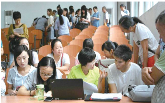
综合测评家长见面会。

量不大,让他们有更多弹性时间去思考、去探索新知识。教学中,他都坚持“繁简得当”,“将今后高中阶段不适用的部分省略带过,对于今后学习的重要部分,则会更花心思去讲解。”