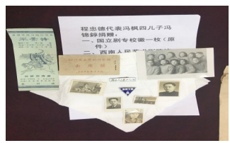
珍贵照片和校徽等。

4月24日，“中国戏剧摇篮”宜宾市江安县举办了国立剧专先辈余上沅、曹禺、张定和珍贵手迹捐赠仪式。59件与江安国立剧专相关的照片、书信、手迹原件等珍品将被国立剧专史料江安陈列馆收藏。