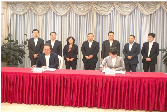
自贡高新区携手央企中建材打造“三新产业园”。

作为自贡经济发展的“主引擎”和“排头兵”，实体经济一直是自贡高新区发展的主动力，在自贡加快建设全国老工业城市转型升级示范区的发展机遇下，怎样有力推动产业结构转型升级，怎样切实把实体经济做实做强做优，怎样持续推进战略性新兴产业发展……今年以来，自贡高新区率先“破题”，筑牢实体经济根基，加快布局新产业，招商引资再提速，一个个重大项目落地开工，为创新发展蓄足新动力。