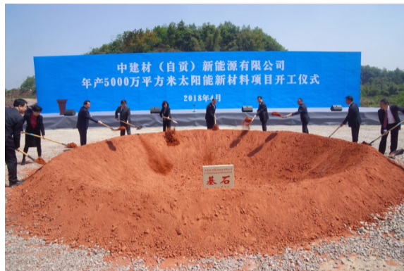
年产5000万平方米太阳能新材料项目开工。