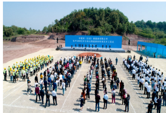
年产5000万平方米太阳能新材料项目在自贡高新区开工。