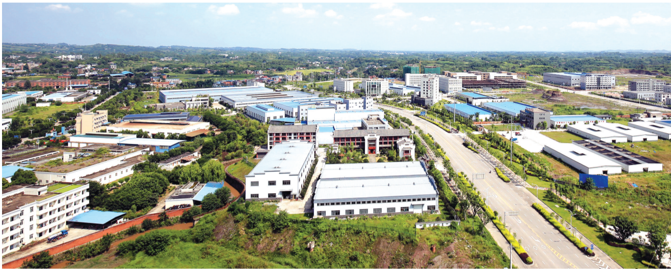
工业园区建设稳步推进。

这一年,荣县经济发展稳中有进、持续向好,地区生产总值实现225亿元,主要经济指标增速高于全省、快于全市、好于预期。工业经济焕发活力,新增规模以上工业企业8户,传统优势产业总产值增速达20%以上,盐业、医药制造业均实现45%以上增长,被命名为中国(西部)陶都。现代农业质效齐升,农业增加值保持全市第一,成功创建省级农民增收新产业新业态示范县,代表四川跻身国家首批农业可持续发展试验示范区。第三产业稳步提升,现代商贸服务、文旅产业等加快发展,新增规模以上服务业企业和限上商贸企业6户,世界零售巨头沃尔玛入驻荣县并开业运营,大农和“六农对接”模式成为全省农村电子商务典范。金融机构贷款余额增长27.6%,高于全市11个百分点,贷存比高于全市6个百分点。