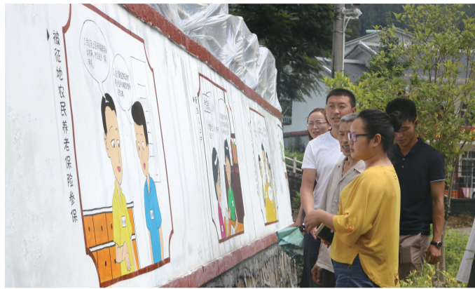
群众正在仔细查看“小微权力”清单的漫画。

扶贫领域的“微腐败”如芒在背，整治“微腐败”如箭在弦上。去年以来，万源市纪委监委始终把整治基层“微腐败”贯穿脱贫攻坚全过程，开出“小微权力”清单，利用“互联网+监督”模式，建立脱贫攻坚互联网监督平台，严管村级“小微权力”，坚决减少“微腐败”存量、遏制“微腐败”增量，为打赢脱贫攻坚战提供坚强的纪律保障。