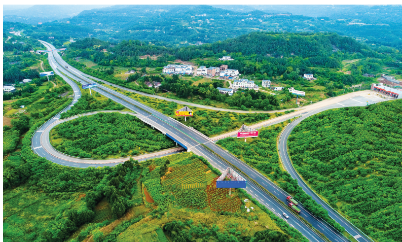
成巴高速恩阳互通。