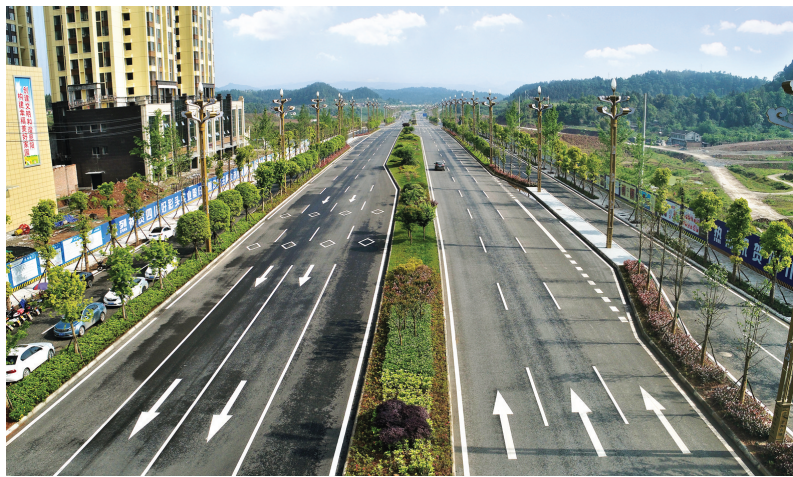
恩阳大道何家坝段。