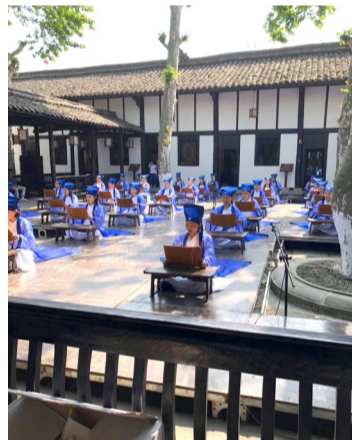
阆中自古读书藏书之风盛行。