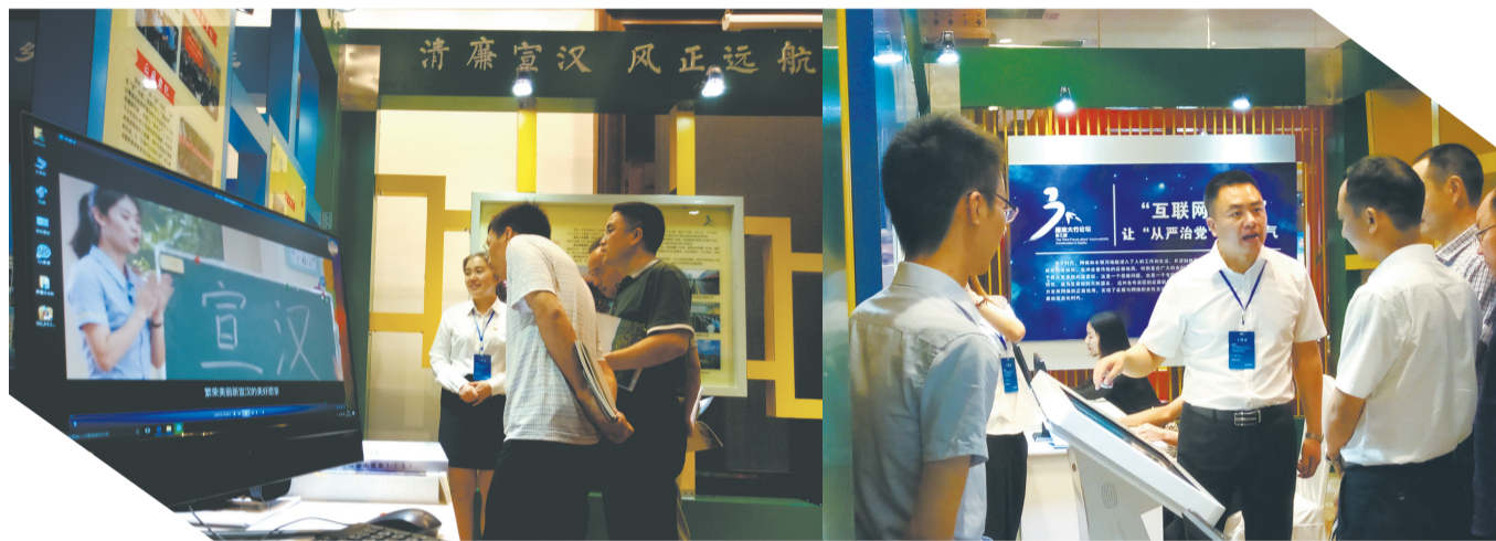
与会人员在大竹宣汉展厅交流学习。

除开设了展厅外，由中国社科院中国廉政研究中心主办的第三届廉政大竹论坛，还包含座谈会、集中讨论、实地调研等多种形式。互联网+反腐、农村“三资”管理、建立防治“微腐败”体系……论坛举办期间，全国廉政经验在此汇聚，独具特色的交流互动平台，让本届论坛精彩不断。