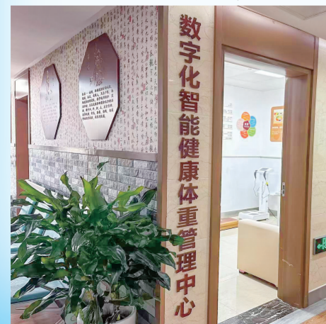
数字化智能健康体重管理中心。

在龙华社区卫生服务中心，家庭医生承担常见病、多发病的诊疗工作，更是居民健康的“守门人”，尤其在慢性病管理、康复指导、健康宣教等方面发挥着不可替代的作用。他们将专业医疗服务延伸至社区“最后一米”，守护千家万户的健康，让居民在“家门口”就能享受到连续、贴心、高效的医疗卫生服务。