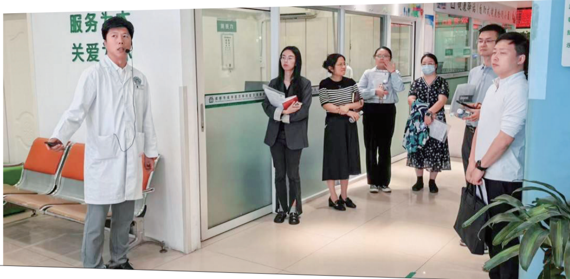
专家团队走访调研。