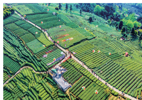
希望的田野。