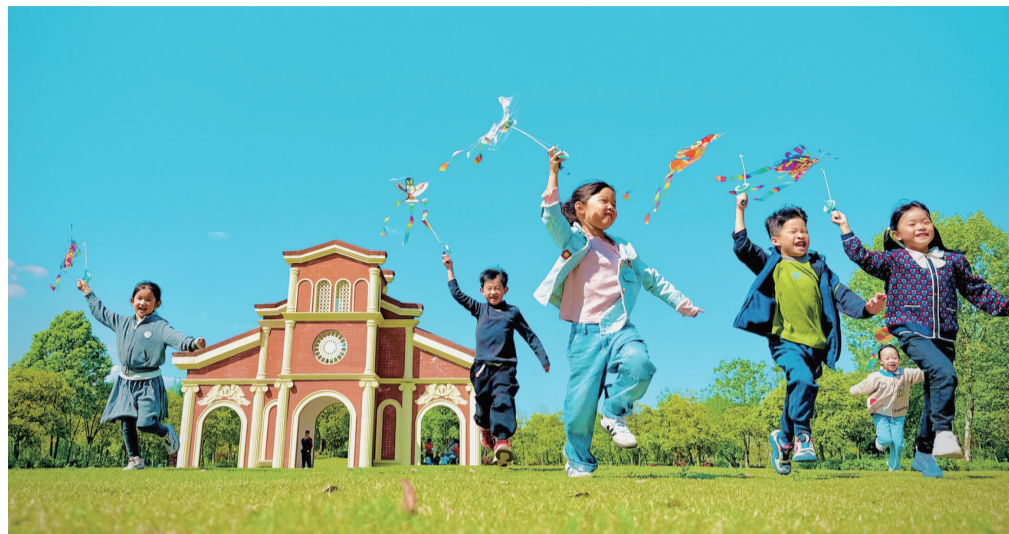
追逐春天。

在这里,流水虚张声势 小桥儿女情长 遗忘与铭记,都无关乎一只小船 定格于自己的命数 那些过去的传说,已无法重来 尽管水路遥遥 但桥下的沉舟既长成老槐 就无需春风,也可以吐露新芽 对岸的海棠树 仍在用悲歌追忆,前朝的花事 听听那古怪的节奏 仿佛要重构季节的秩序 还是那一场春雨 足够任性,非要把整个平原 据为己有。是青山种蓝天 还是绿水养白云 其中的天机,谁也弄不清 我只能说,风吹黄昏 粗犷或精细,不管以什么方式 看上去,都是一种格局 站在锦江之上,我只好遵从 一条流水无声的古训