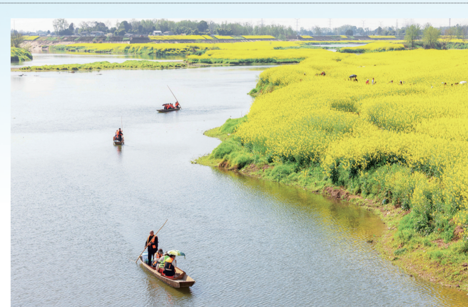
人在画中游。

为保障游客安心游玩、放心消费，本届采摘节多措并举筑牢服务保障防线。当地将统一规范经营标准，加强对桑葚价格、品质的全程监管，杜绝哄抬物价、以次充好等行为；组建专业化志愿服务队伍，为游客提供引导、咨询等贴心服务；同时落实道路保畅措施，优化交通疏导，全方位为游客营造安全、有序、舒适的游玩环境。