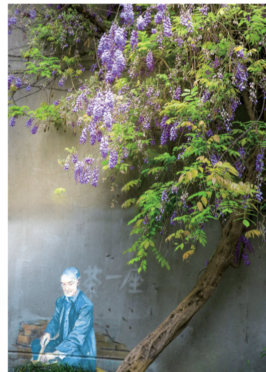
紫藤花开。

华西社区报联合川观新闻“交换春天计划”上新啦：田野里的油菜花，邻里分享的时令美味，晒太阳的老人，踏青途中的欢声笑语……每一帧都是家门口的春天。让温暖继续流动，一起来看邻居们镜头里的最新春色！