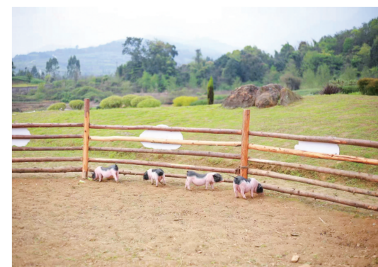
春田猪猪运动会。