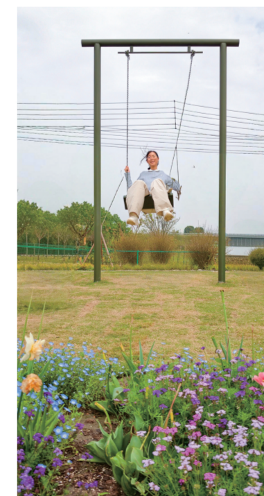
把春天荡进心里。