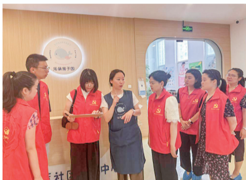
志愿者走进社区托育中心。

今年3月12日,志愿者们又一次走进芦蒿社区托育中心。围绕保育管理、健康管理和环境安全,医院儿童保健科支部的党员医生们逐一查看活动区、休息室、洗手间的设置细节,现场与托育老师交流常见传染病预防要点。一名志愿者蹲下身,仔细检查墙角防撞条的牢固程度,边检查边对身边的老师说:“小朋友活动的空间,安全上一丝一毫都不能马虎。”这是项目启动以来的常态,也是今年医院重点打造“医育同心,护苗成长”党建品牌的前奏。