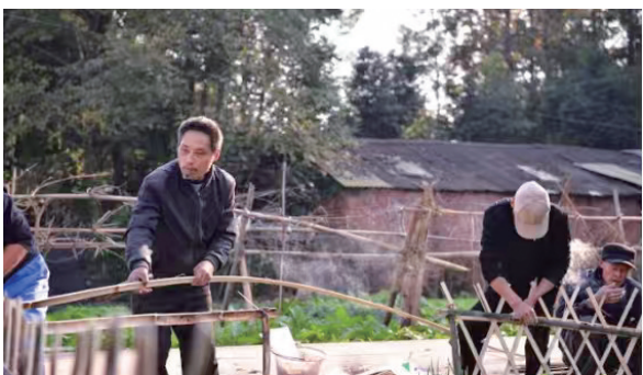
居民齐动手，让乡村亮起来。

“散乱污”问题突出。白马村坚持“大家的事大家商量着办”，通过坝坝会汇聚村委会、企业、志愿者和村民多方力量，围绕“清脏、治乱、增绿”展开攻坚。行动聚焦三大关键：疏通沟渠根治内涝、彻底清理垃圾与杂乱菜地、拓宽路基保障通行。村民主动配合，本地企业也以优惠价提供护栏等支持，真正体现了“众人拾柴火焰高”。如今面貌一新的张家湾，计划进一步增绿添景，未来将与邻村协同打造休闲广场，其成功经验也将在全村推广。