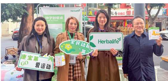
居民热情参与到活动中。

作为“全民动起‘菜’”系列活动的尾场,此次活动延续了首场活动的热烈氛围,将健康理念与品牌宣传巧妙融合。现场精心布置,色彩鲜艳的展板以及趣味十足的互动区,营造出浓厚的运动氛围,充分彰显了主办方对健康生活