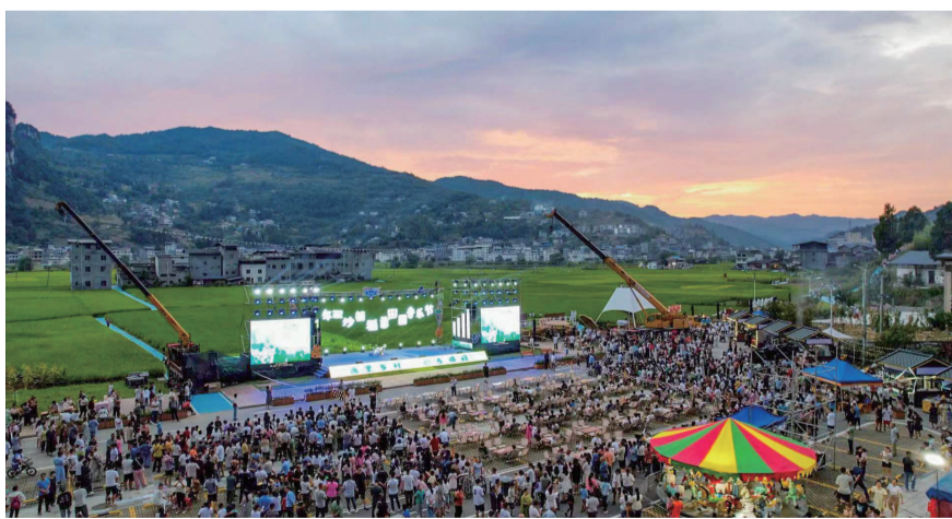
稻香田园音乐节活动现场。

“音乐节是推动双沙镇农旅文旅融合发展的一次尝试。期望借由活动为群众带来欢乐和丰收的喜悦,让更多游客了解双沙美丽的风光与深厚的文化底蕴,助推乡村振兴。”双沙镇党