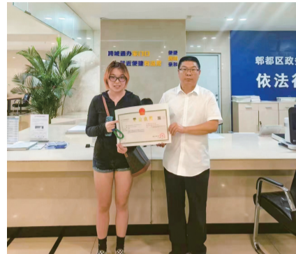
领取新的营业执照。

今年7月1日起，郫都区正式上线“企业信息变更一件事”全流程办理，可实现企业变更登记、印章刻制备案、企业社会保险单位参保信息变更等7个事项联办，通过跨部门数据实时推送，实现各环节并联办理，避免重复申请、重复提交、重复审核，大幅减少办事环节、申请材料、办理时间和跑动次数。