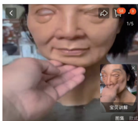
某电商平台搜索“人脸面具”截图。