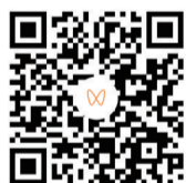
扫码观看小区门禁安全测试视频。