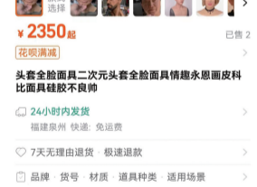
“人脸面具”销售商家截图。