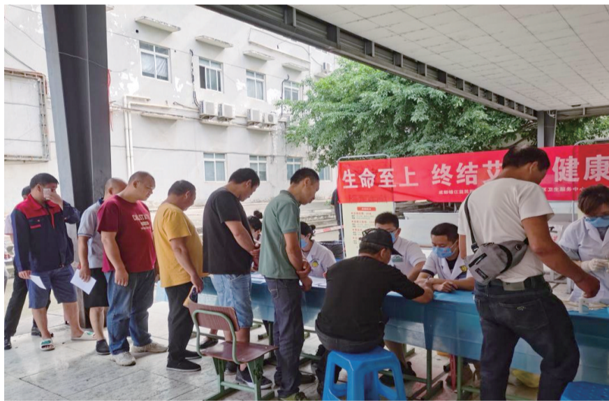
艾滋病一级监测哨点。

外出务工求职人员流动性大,文化水平参差不齐,对艾滋病传播知识了解不足,缺少防控自我保护意识,从而增加了艾滋病病毒的传播风险。哨点监测工作,不仅是对求职者及流动