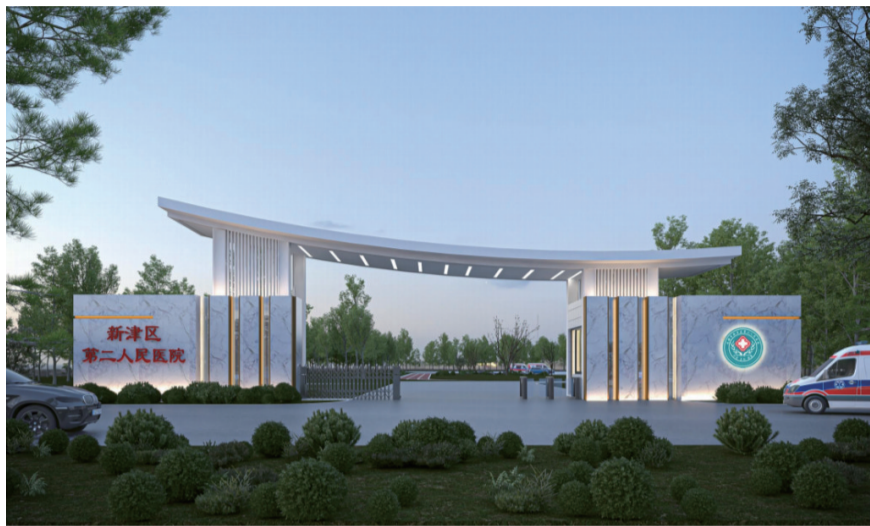
成都市新津区第二人民医院。

2019年,医院在成都市成立区(县)级心理健康服务中心,先后挂牌成都市新津区未成年人心理成长中心和成都市新津区职工心灵驿站等。医院通过聚力“一院区一中心”发展,充分发挥精神卫生和心理健康专业优势,创新推进社区防治,不断提升医疗