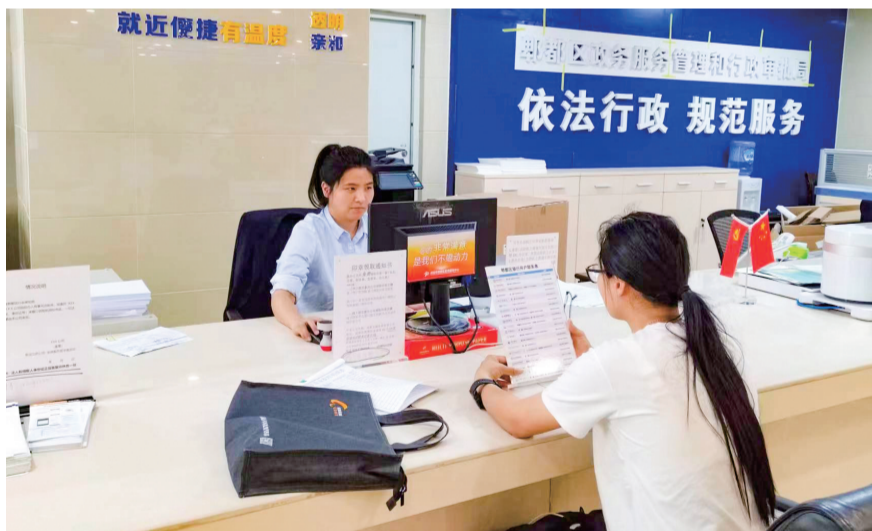
郫都区政务服务大厅为市民提供便捷服务。

成都市郫都区从企业的实际需求出发，依托四川省政务服务网、天府蓉易办平台，在线完成营业执照信息核验，将关联性强的“食品(含保健食品)经营许可核发、招牌设置许可、公众聚