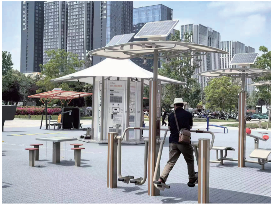
智能健身器材带来新的运动体验。

据了解,这个室外智能健身房采用了行业最新一代全民健身智能器材套装,集合了5G应用、物联网、云计算、大数据及运动健康科学等最新“黑科技”。市民首次使用时只需微信扫码登录,便可通过人脸识别“打卡”所有设施。设备屏幕上会显示个人的体质健康指标及各项运动数据,包括健身方式、强度、时长、频次、总量等“运动处方”。后台还会对个人运动表现进行精确分析,为市民量身定制运动计划。