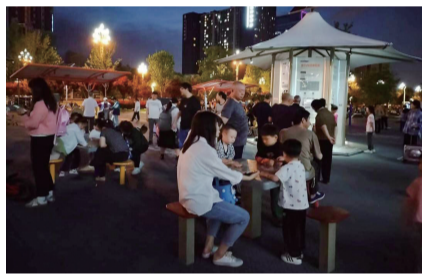
晚上也有市民前来运动。

不仅如此,该组健身设施还可以进行体质检测,提供健康评估报告、运动训练指导,还可以通过有氧训练、各个部位肌群的肌肉力量训练、拉伸放松训练等训练中,进行再测试再评估,提供全周期全要素的健身服务,实现千人千面个性化定制健身课程。