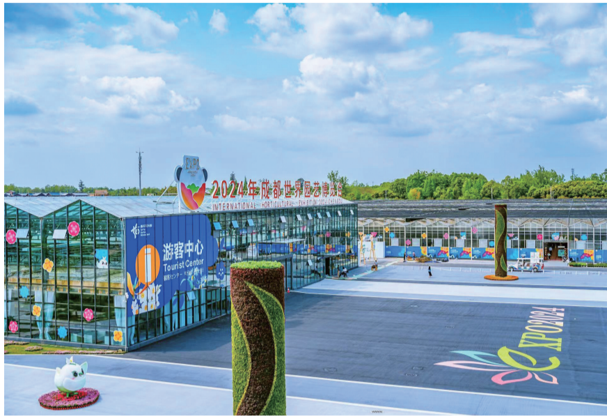
2024年成都世界园艺博览会郫都分会场准备就绪。

另外,所有商铺统一制作了店招。新店招大气美观,有店名、产品信息,也有联系电话等,画面舒朗,画风和花市相得益彰。馆内新增了80余组博古架,用于盆景陈列。既提升了产品气质,也提升了馆内颜值。交通线路也进行了重新优化。园内机动车、