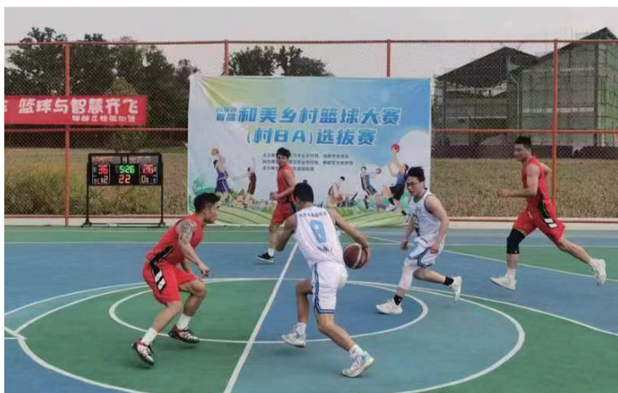
成都“村BA”选拔赛在东林村打响。

当天的比赛共有郫都区德源街道、大邑县青霞街道、东部新区贾家街道和崇州市元通镇4支队伍参与角逐。他们将角逐两个参加四川省和美乡村篮球大赛成都区域赛的名额。