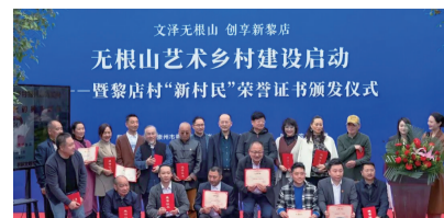
黎店村“新村民”荣誉证书颁发仪式。

浮式生态桶随着水位变化自动上浮或下降，能够较好抵御夏季水位快速变化对水产养殖带来的风险。生态桶上部有一圈换水小孔，在换水过程中，形成轻缓冲击力，帮助鱼儿“健身”，增强鱼儿肉质紧实度。生态桶底部为锥形，便于集中鱼类粪便并通过底部吸出。吸出的粪便等污物将在岸上的尾水收集区进行集中处理和资源化利用。该技术的鱼粪回收效率在90%以上，可成为有机肥料作为替代化肥的主要肥源，解决了传统网箱养殖水体污染问题。