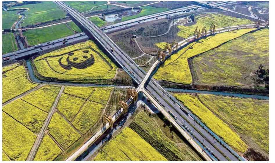
俯瞰田野。