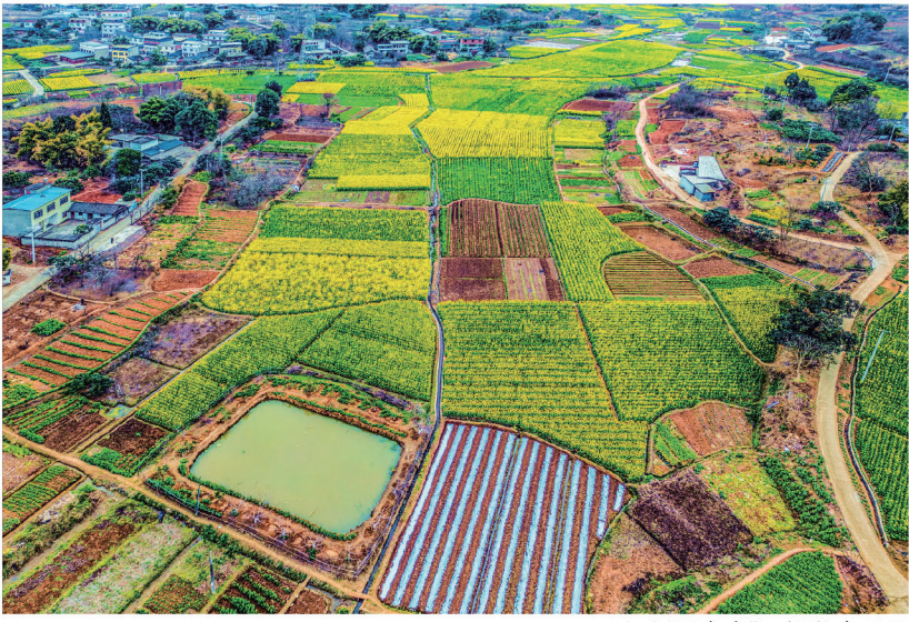
大地“调色盘”。