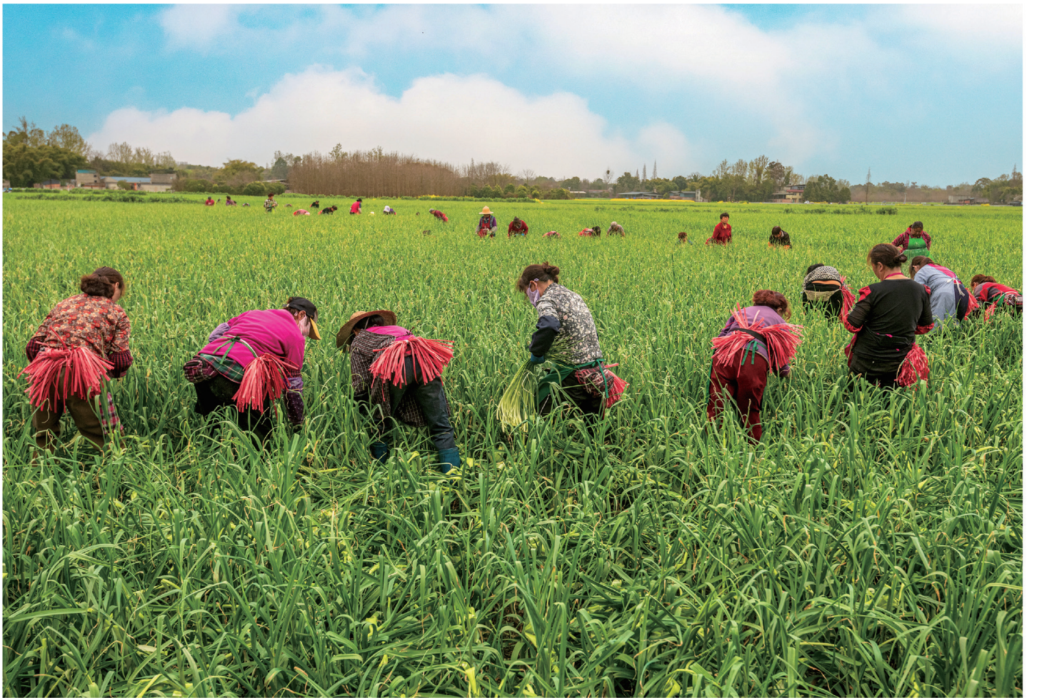
温江居民打蒜薹。

春季雨水增多、气温回升，田间万物生长，正是春耕的好时节。犁铧翻开泥土，播下饱含希望的种子，一幅“人耕大地，春生万物”的春耕图正在蓉城大地徐徐绘就，奏响春耕“协奏曲”。