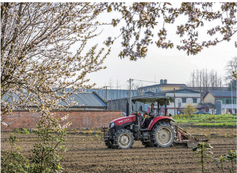
现代农机的轰鸣“唤醒”沉睡的土地。