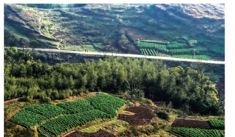
绿油油的蔬菜。