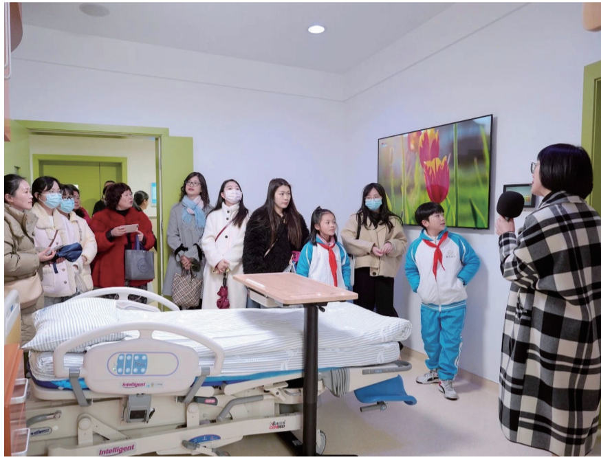
“健康观察团”为医疗卫生工作“把脉”。

为进一步构建和谐医患关系,拉近医患之间的距离,积极推动辖区卫生健康事业高质量健康发展,2月28日,郫都区卫健局组织开展“鹃医问政-医院开放日”活动,由区党代表、区人大代表、区政协委员、媒体代表、患者家属代表、群众代表等40余人组成的“健康观察团”走进郫都区人民医院、郫都区妇幼保健院、安靖街道社区卫生服务中心,共同为医疗卫生工作“把脉”。