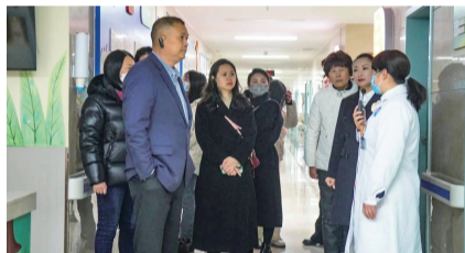
“健康观察团”认真聆听医院情况介绍。

在郫都区妇幼保健院,观察团成员深入了解“家庭式一体化产房”创新模式,感受医院在改善分娩体验方面所做的不懈努力;在融合了“党相伴·童成长”理念的党建文化阵地,感受红