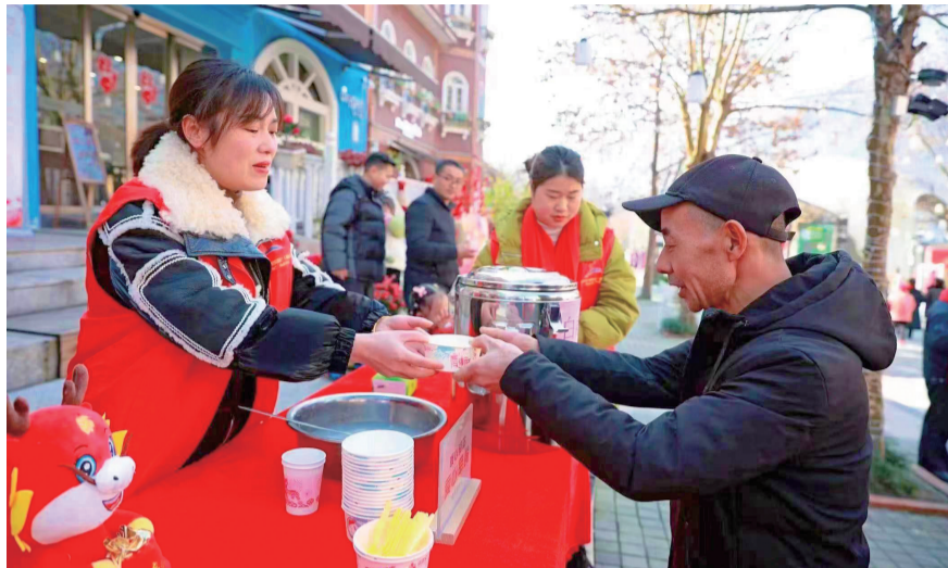
白鹿场社区“鹿长”服务站免费为游客提供汤圆。

另外,海窝子古镇、通济驿站等重点旅游场所提供便民饮水服务点共计7处,让游客能喝到一杯暖心暖胃的热水。大年三十到海窝子古镇佛林寺祈