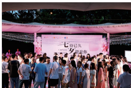
盛乐社区“七待已久,夕望是你”品牌活动。

资源联动、合作共建的方式,开设包括盛乐社区党群服务中心、大源中央公园(源野、社区运动角)、高新区文化活动中心(图书馆、群团之家)、国际人才港、复城国际党群服务中心(青年之家、职工婚恋)在内的“五”个青年服务点位,形成盛乐社区青年文化集群。