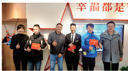
表扬先进典型,颁发积分激励证书。

盔,从自身做起,坚决杜绝闯红灯越线、逆行、横穿马路等交通违法行为的发生,自觉遵守道路交通法律法规,做到安全文明出行。