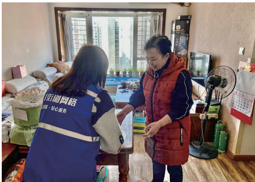
网格员为居民送餐上门。