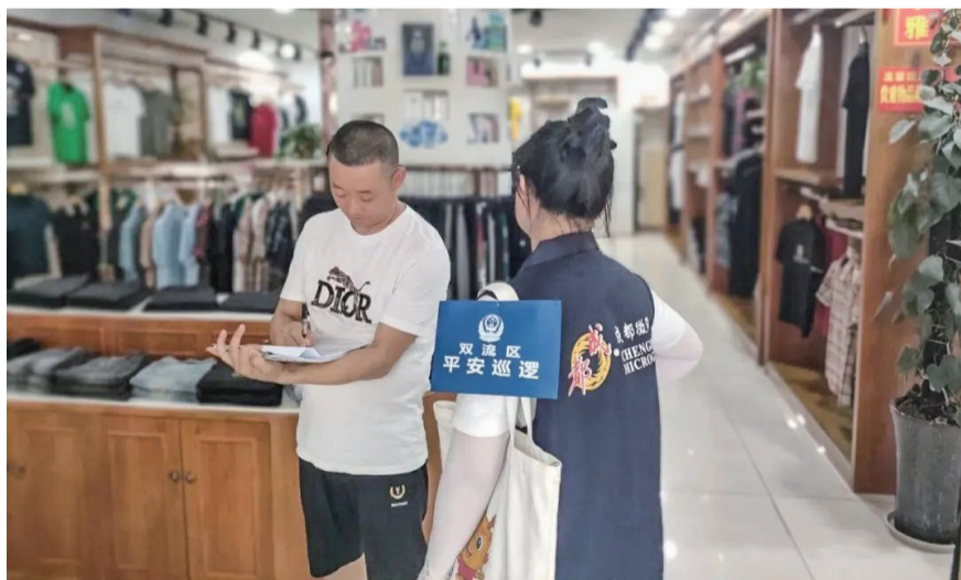
龙桥小区安全志愿队伍走访辖区商户。

为了不断完善安全风险防控队伍体系，系统化开展龙桥小区安全治理工作，成立龙桥安全微治理委员会，设