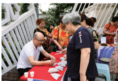
中医药文化主题游园会。

涵。金泉社区卫生服务中心作为“一核多点”的首个试点单位,建立了党建品牌科室,开展了沉浸式中医药研学活动,创新推出了“随享家医”服务平台,有效提升了群众就医满意度和获得感,是金牛卫健系统细化“七有标准”率先打造的