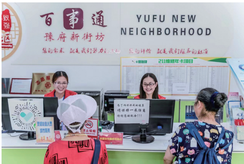
为民办实事、解难题。