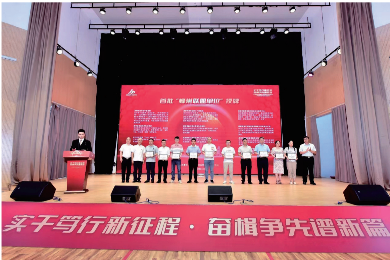
“红色蜂巢”微网实格治理新模式。