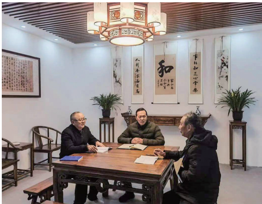
“亲邻堂屋”的门厅大体还原了传统堂屋的布局。

“亲邻堂屋”的门厅大体还原传统堂屋的布局,中间的“和”字体现出银定新区“居民和善、家庭和睦、小区