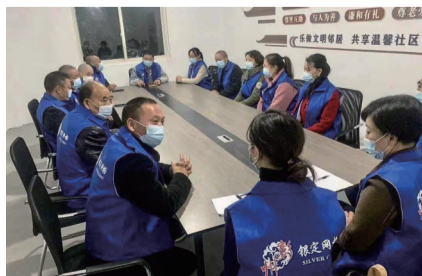
亲邻堂屋内设有“微网实格”会议室。