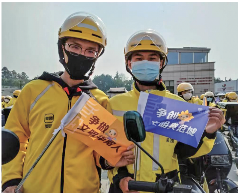
外卖小哥成为展示文明形象的“流动窗口”。

“目前,我们的‘流动网格大军’已达到235人之多,主要是快递小哥、外卖小哥等华阳街道范围内的流动群