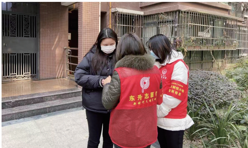
微网格员向居民分发“解忧服务卡”。

如何焕发网格活力、激发多元共治热情?记者了解到,东升街道在创新实践中,着重在五个“一点”上发力。一是实现部门镇街联动,做到体贴深一点。街道相关负责人介绍,在区总工会支持下,依托“棠湖中心职工驿站”建立了“微网格员加油站”,常态化为微网格员、外卖员、环卫工人、快递员等户外群体和新就业形态劳动者提供临时休息、热水供应、手机充电、免费阅读等服务,“圈粉”了一大批网格粉丝;二是开展现场拉