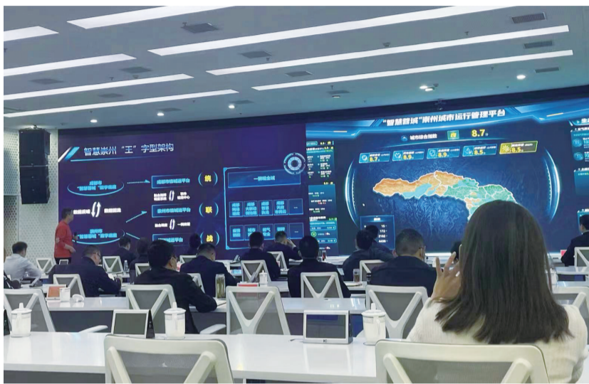
崇州城市运行管理平台

2022年以来，崇州市切实推动网格党建与网格治理服务深度融合，推动“微网实格”实现全域覆盖，不断提高基层精细化治理、精准化服务水平。