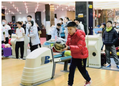
小学生接受国手指导后练球。

保龄球运动是室内活动，不受时间、气候等外界条件影响，不受年龄限制，易学易打，是一项男女老少皆宜的体育运动。保龄球运动集趣味性、对抗性和技巧性于一体，给人以身体和意志的锻炼，因此深受成都市