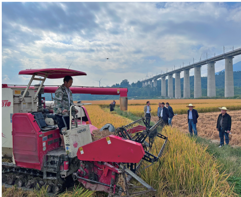
机械收割水稻。

3月22日,“卓两优 1126”开始在阿月村播种,5月9日至10日进行移栽,7月15日齐穗。10月22日,四川省农村科技发展中心组织湖南省农业农村厅研究员青先国、四川水稻育种攻关首席专家郑家奎、四川农业大学教授黄富、成都市农业技术推广总站研究员曾必荣、西昌学院教授蔡光泽组成测产验收专家组。工作人员在专家组成员指导及见证下,按照农