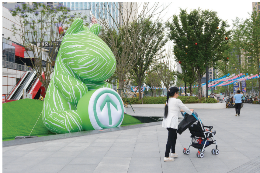
广场上的大型“绿马”。

据了解,鹤林社区大部分为商品楼小区。在疫情防控工作上,该社区总结出有效的防疫宣传方法,针对社区实际以“无接触宣传、精准宣传、全覆盖宣传、参与式宣传”四种模式开