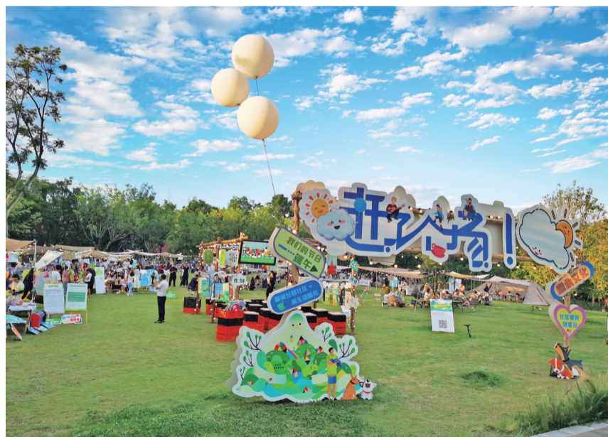
天气晴好,便民邻里节引来众多居民。

本次邻里节创意集市内容丰富,活动现场不仅有接地气的“磨了个刀”和“剪了个头”等贴心便民服务活动区,还有最受小朋友喜爱的“吃香香香嘴ber”活动区,多样美食吸引了众多居民的目光。端午节即将来临之际,在本次创意集市“我们的节日—端午”主题活动区,社区以现场教学的方式,让居民特别是小朋友们近距离感受中国传统文化魅力,大家可以参与制作粽子、香包,了解端午知识、历史小故事。另外,还有充满艺术魅力的“艺术expo区”和“eco-life区”等20多家有趣有料的摊位,可以进行园艺分享、植物拓印、儿童旧物置换义卖等。在民生小摊及警察小屋区,居民可享受便捷的法律咨询服务,社区安全警示带现场循环播放防震减灾、公益广告系列视频,对大家进行安全教育。相对比较热闹的是萌宠大会区,当天有宠物免费服务体验,专业人员还进行了宠物养护知识分享,宠物飞盘等游戏让现场更加热闹。