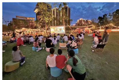
夜幕降临,居民在草坪上观看坝坝电影。