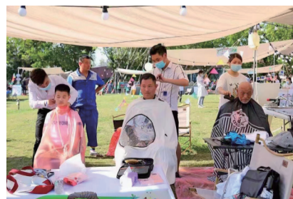
居民享受理发服务。