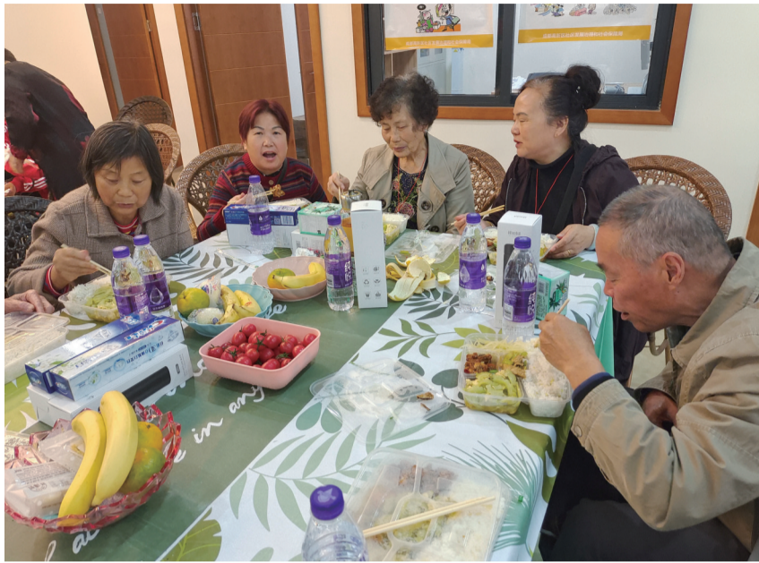
老年人吃饭更方便了。

3月18日，记者获悉，石羊街道辖区的14个社区老年人助餐服务点即将全面上线，进一步完善健全辖区助餐服务体系。各服务点将围绕老年人特色供餐、就近用餐、营养配餐的用餐需求，切实提供精准温暖贴心的保障服