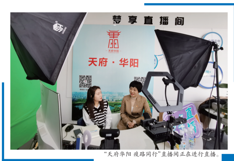
“天府华阳 疫路同行”直播间正在进行直播。

分享者之一，他说：“疫情期间，养宠物有很多注意事项，我很愿意通过线上的方式给我们的居民科普知识，让大家在关注自己的同时，更好地养好宠物，平稳度过居家隔离的日子。”