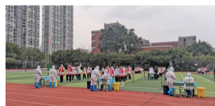
医护人员为学生做核酸检测。

成都疫情再次袭来,众多医务工作者义无反顾成为勇敢的“逆行者”,奋战在抗击新冠肺炎疫情的最前线。在战“疫”一线,一份份按着鲜红手印的请战书、一封封饱含家人牵挂与思念的信件,感动着人们。