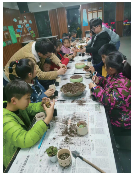
多肉植物课吸引众多儿童参与。

据了解,“吃货”们喜欢的食育体验场景有食育科普讲堂、营养烹饪教室、感官实验室、食物图书馆、社区儿童食堂等10余个,每周围绕食物、生活与儿童教育议题,在社区开展定期社群分享。同时,社区构