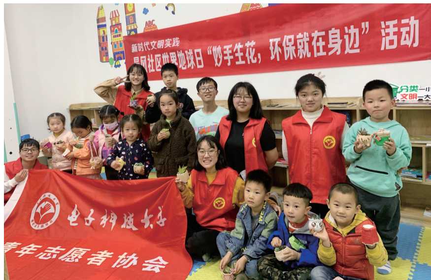
社区开展“妙手生花，环保就在身边”活动。