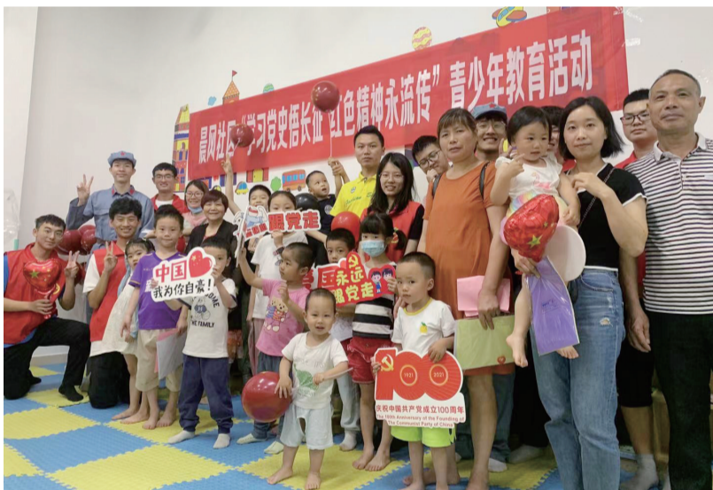
社区举办“学习党史悟长征·红色精神永流传”青少年教育活动。

小区党支部牵头向金辉悦府开发商提出三期开发诉求，引入影城等生活娱乐配套服务；打造“和善党支部”活动阵地，构建小区党群交流、协商