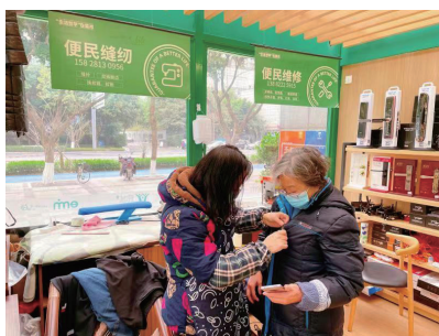
可提供多种便民服务。

小站位于锦城大道益民菜市旁，红绿基调的配色，渲染出明亮与积极向上的氛围，站内配置了休息桌椅、饮水机、可租借雨具、充电器、应急药箱等便民配套，居民可以在小站内小憩，也可就近处理衣物缝补、家电维修、管道疏通、开锁换锁等日常生活小事。