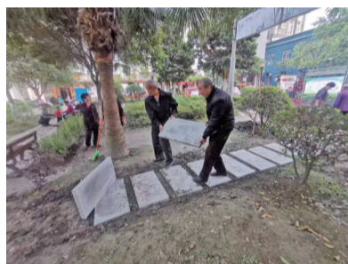
居民参与小区治理。