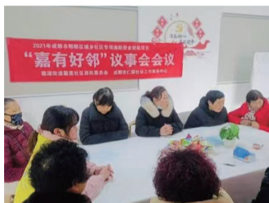
居民议事会共商共治。