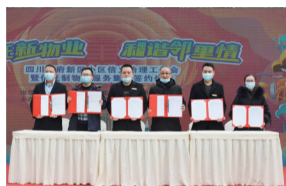
天府新区3个试点小区获“信义小区”授牌。

四川天府新区在社区治理工作上的努力和成绩,同时表示,过去3年,市委社治委把推行党建引领“信托制”物业服务模式作为破解住宅小区信任危机和治理难题的重要突破口,系统性整体性推进小区治理,探索出一条通过制度创新解决基层治理难题的成都实践路径,全市近100个小区正在稳步推进试点。江维强调,在推进信托制物业服务工作中,要始终坚持党建引领,充分尊重居民主体地位,积极借力社会专业力量,边试点、边总结,力争形成一批典型经验,推进