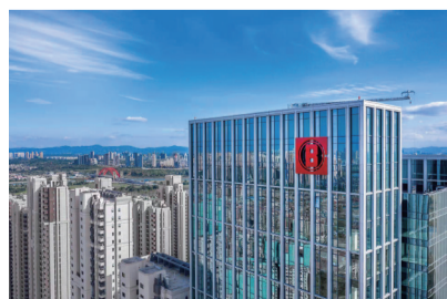
中海国际中心J座写字楼。

中海财富中心项目于2019年12月投入运营,地上31层、地下4层建筑高度约130米,由中海商务打造,是一栋全自持的高品质商务楼宇。在楼宇经济蓬勃发展的天府新区,成都中海财富中心具有一定的开创领先作用,项目在楼宇硬件上全面接轨国际标准,外观设计纵向切割错落有